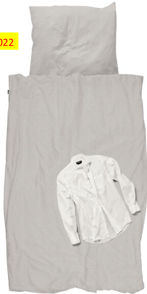
Fresh Laundry Shirt