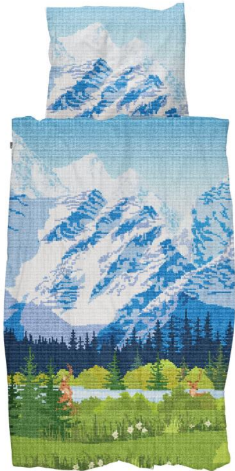
Across the Alps