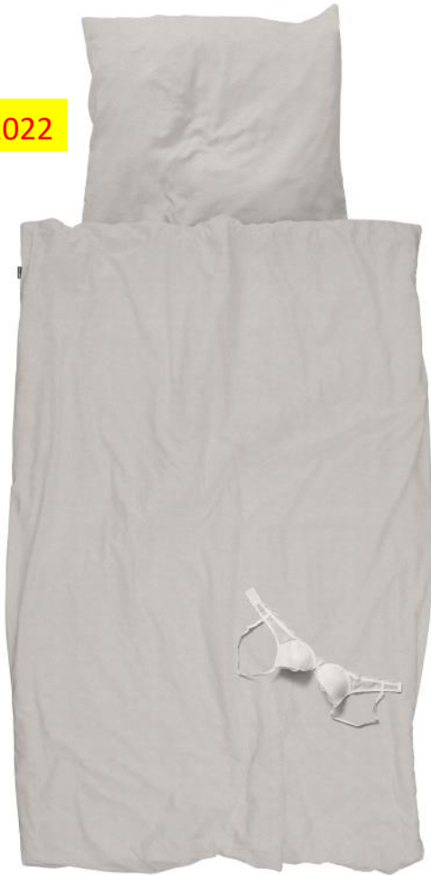
Fresh Laundry Bra